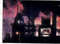
Port Talbot plant

"The closure of the BF and winding down of the heavy end (assets) was something